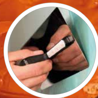
Polierte Blätter und abgerundete Blattkanten für optimale Gleitfähigkeit und volle Kontrolle.