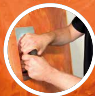
Festes, rostfreies Chrom-Molybdän-Stahlblatt für optimale Kraftübertragung und Werkzeugführung.

Der BiKo GRIFF® bietet eine herausragende Haptik . Das Kork Compound Material verhindert Blasenbildung und sorgt für eine natürliche, angenehme Griffigkeit , die weder rutschig noch klebend ist – ideal für lange Arbeitstage.