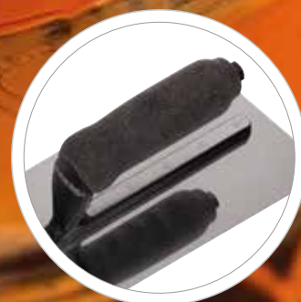
Ergonomischen BiKo GRIFF® für ermüdungsarmes Arbeiten